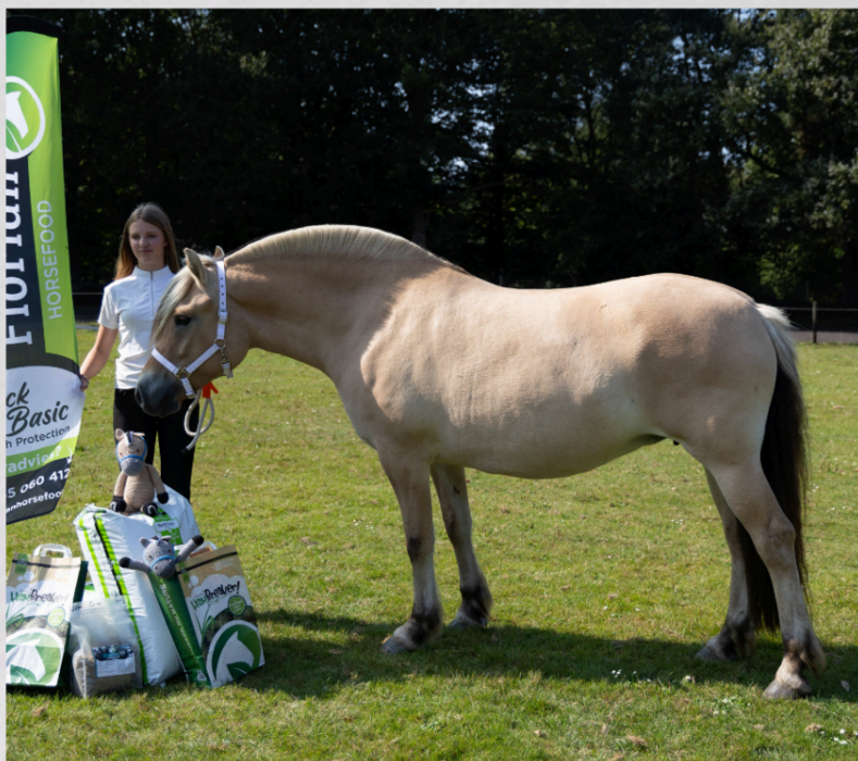
Reserve Dagkampioen Pjella